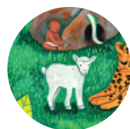
Løftet om en ny verden s. 132

Andre historier, der siger noget om dette