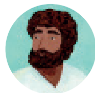
Jesus, den nye begyndelse s. 282

Andre historier, der siger noget om dette