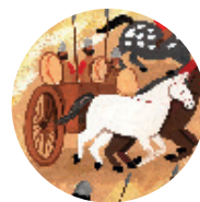
Fordrevet! s. 112

Andre historier, der siger noget om dette